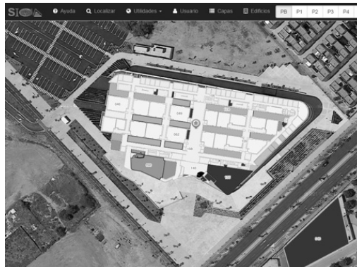
Figura 3. Web-mapping de la Facultad de Educación