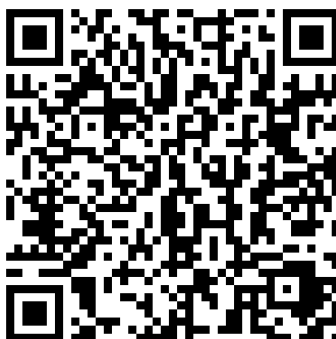
Figura 2. Código QR con el mapa de la Facultad de Educación

A través del siguiente código QR (Fig. 2) puedes visualizar el mapa que servirá para guiarse, y en el que se encontrarán señalados con números los diferentes árboles que deben componer el herbario digital.