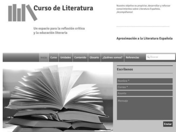
Figura 2. Portada del curso propuesto: Aproximación a la literatura española.