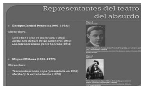
Figuras 5 y 6. Muestras de materiales didácticos del curso: línea de tiempo y presentación.